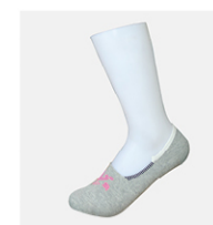
任意隐形毛圈船袜