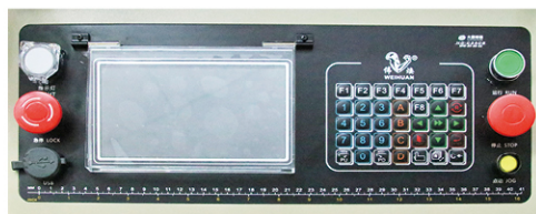
容量更大、速度更快 (内存 16-999 只花型)